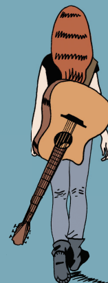
Illustration de la pochette de l'album de Palomino Witchcraft par Elise

Merci à toutes et à tous pour votre participation !